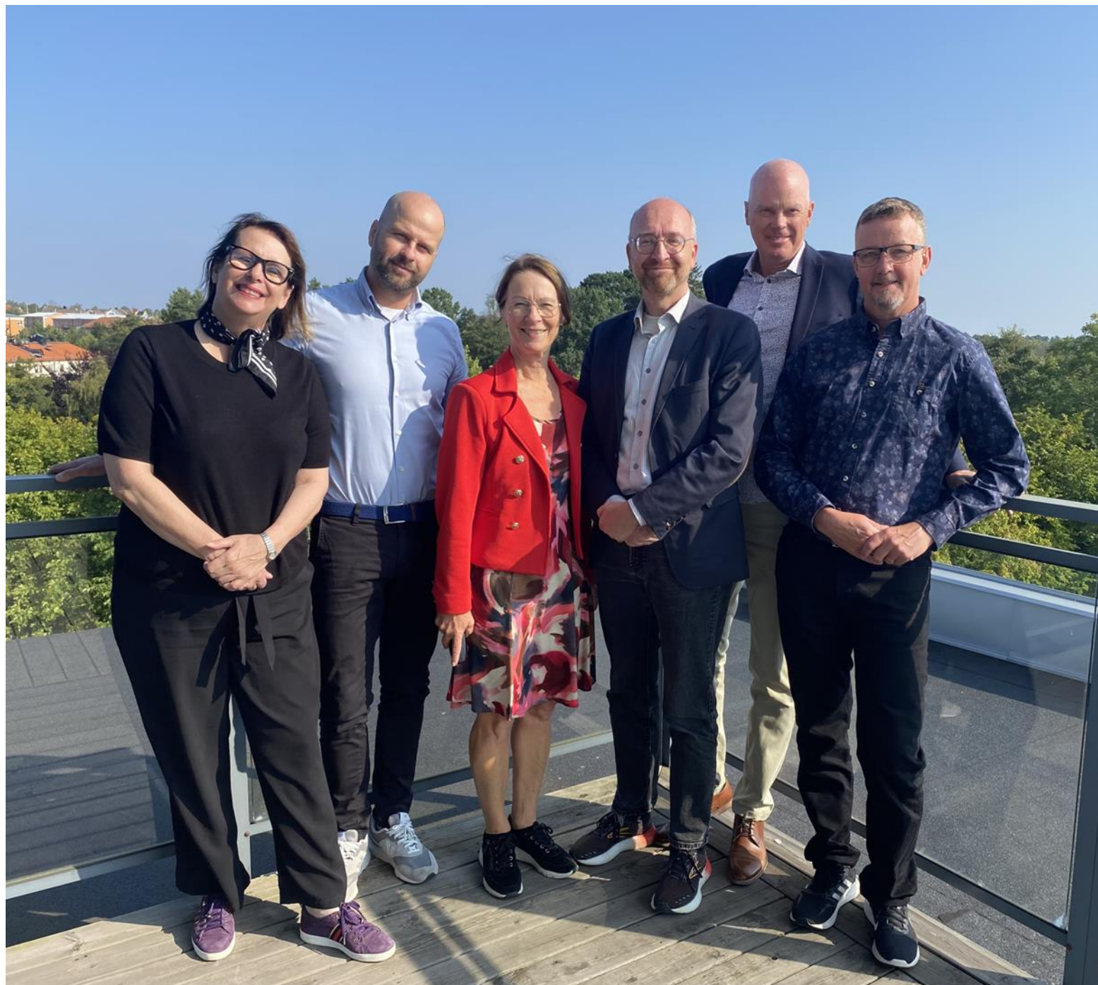
Valberedningen Sparbanksstiftelsen Alfa